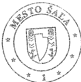
starosta / primátor